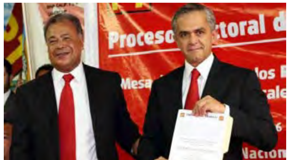
Alberto Anaya, presidente nacional del PT y Miguel Ángel Mancera, candidato de la izquierda