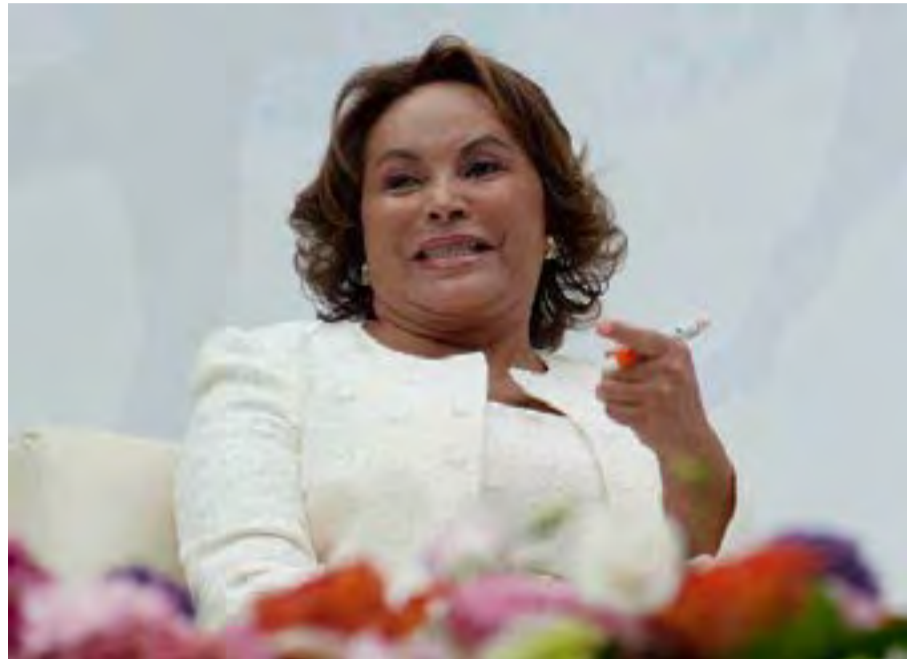
Elba Esther Gordillo, presidenta vitalicia del SNTE

E l movimiento político “Compromiso por México” se constituyó formalmente el pasado 28 de noviembre y éste incluía una alianza entre los partidos PRI, PVEM y el PANAL. La estrategia política y los objetivos eran claros para todos los integrantes. El Partido Revolucionario Institucional encabezaría el movimiento, el Partido Verde lo apoyaría (como siempre) para conseguir algunos curules y el partido fundado por la maestra Gordillo aseguraría el voto del magisterio a cambio de no tocar su imperio en la Sindicato Nacional de Trabajadores de la Educación (SNTE). Para el PVEM y el PANAL, el acuerdo les garantizaba seguir en el poder, pero les quitaba autonomía y les restaba identidad. A pesar de lo anterior, todos parecían entender su rol y asumían su responsabilidad dentro del movimiento. Sin embargo, la semana pasada el romance entre los partidos llegó a su fin. El partido Nueva Alianza declaró que ya no sería parte del movimiento e iría a las elecciones presidenciales por cuenta propia. Me parece que ha sido un mal cálculo de ambos y viéndolo desde el punto de vista estratégico, pasaron de un juego de ganar-ganar a uno de perder-perder. La separación del PANAL habla de un PRI que no supo negociar y ahora tendrá que asumir el costo. No sólo contará con un menor apoyo y en consecuencia con una menor cantidad de votos, sino que abre la posibilidad a los demás partidos ante la inminente pérdida de fuerza política.