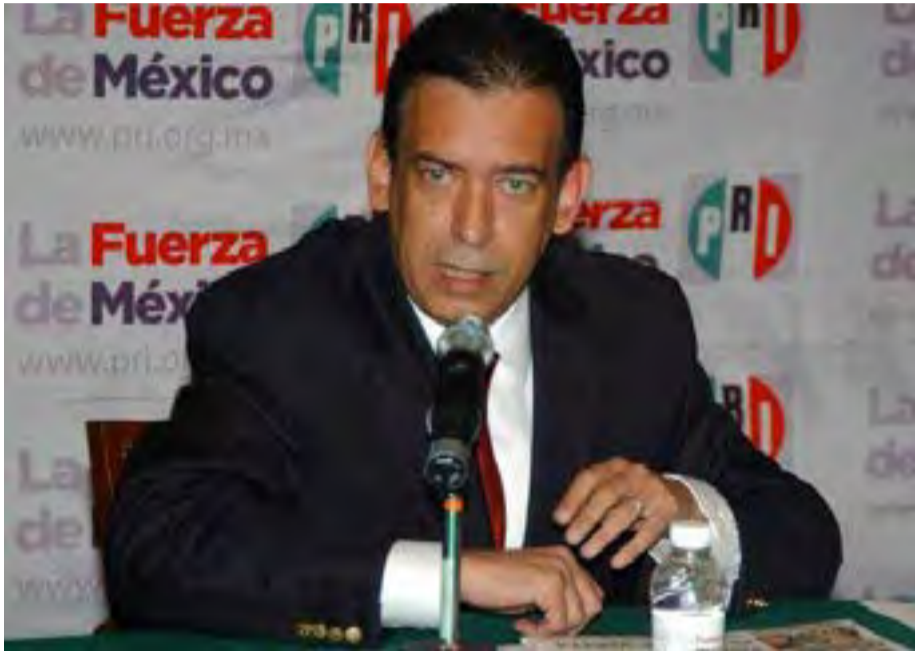
Humberto Moreira, ex dirigente nacional del PRI