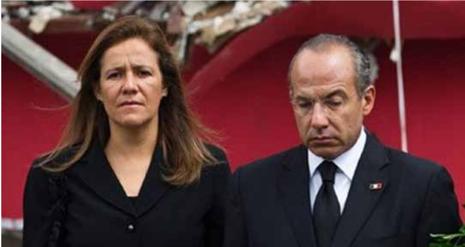
Felipe Calderón y Margarita Zavala en homenaje a muertos en casino Royale

Todo parece indicar que Calderón se autoexilia terminando su sexenio igual que lo han hecho los cuatro últimos presidentes. Víctimas del repudio popular por corruptos, ineptos, ineficientes e ineficaces, culpables de haber entregado un país peor de como lo recibieron, de haber traicionado a quienes votaron por ellos, de haber incumplido todas sus promesas, no les queda otra alternativa que largarse. Pero además, con enemigos por todos lados, temerosos de sus vidas, imposibilitados de salir a las calles y escuchar los abucheos.