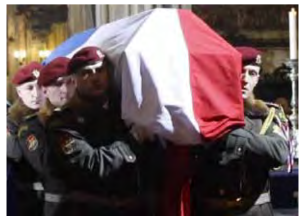
Funerales de Václav Havel