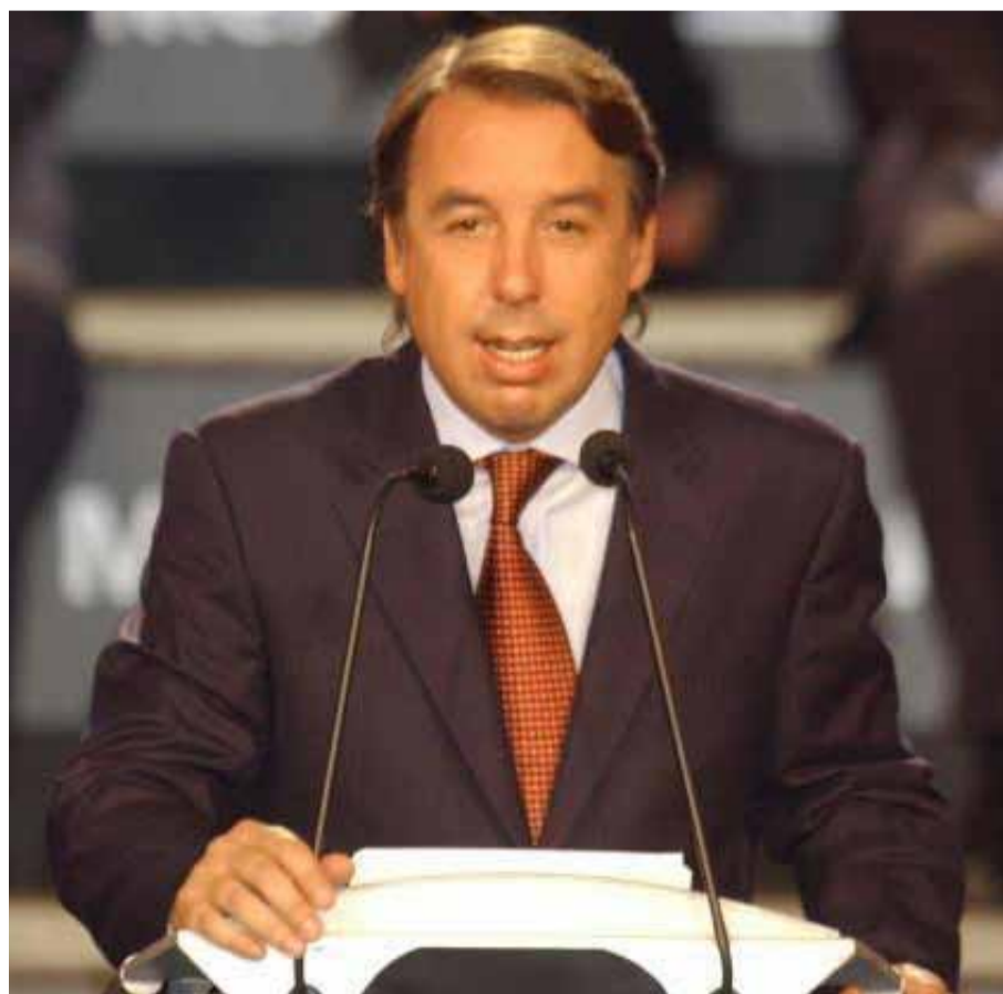
Emilio Azcárraga Jean, dueño de Televisa