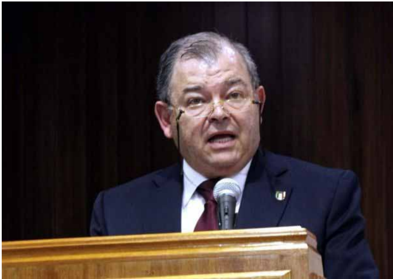
Edgar Elías Azar, presidente del Tribunal Superior de Justicia del Distrito Federal

Cada vez es más cínica la relación entre el dinero y la política; muchos hombres de negocios se han metido a la política y claro, muchos estadistas se vuelven magnates.