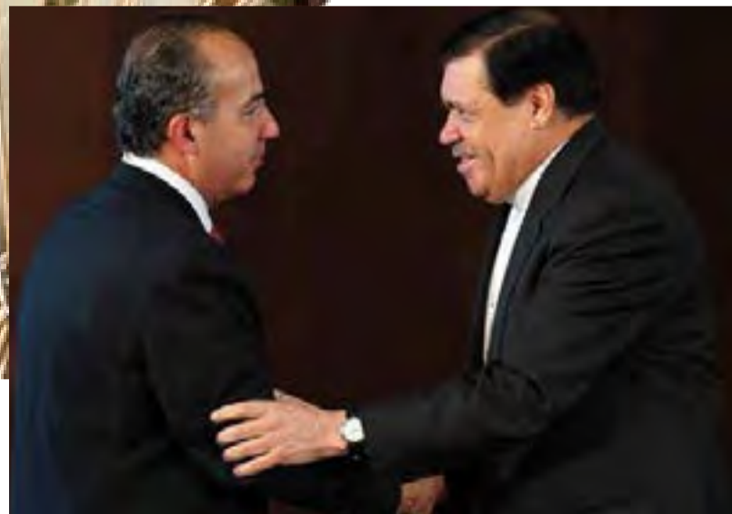
Felipe Calderón y Norberto Rivera Arzobispo primado de México

giosa y la libertad de conciencia de las personas, hoy día tan nombradas por la alta jerarquía eclesial, pero que ellos prohibían en el pasado.