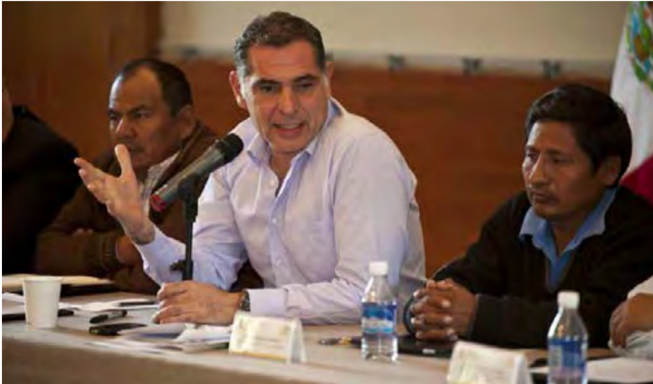
Gabino Cué, gobernador de Oaxaca.

1. Hasta ahora ni en el papel ni en el ejercicio del poder se han apuntalado con decisión y firmeza decisiones y políticas públicas que pudieran estar encauzando a Oaxaca hacia un rumbo distinto al heredado por el viejo régimen. Las decenas de iniciativas de leyes secundarias que le darían vigencia e institucionalidad a las reformas constitucionales de abril del 2010 permanecen en su fase de “estudio en comisiones”, si no es que de plano desechadas en la LXI Legislatura, ante el notable fracaso del poder ejecutivo para diseñarlas, procesarlas y encauzarlas en tiempo y forma. Dichas reformas, habrá que recordar, fueron el primer producto “histórico” del nuevo régimen para cumplir con su promesa de promover un nuevo arreglo jurídico e institucional que sentara las bases para la multicitada transición democrática.