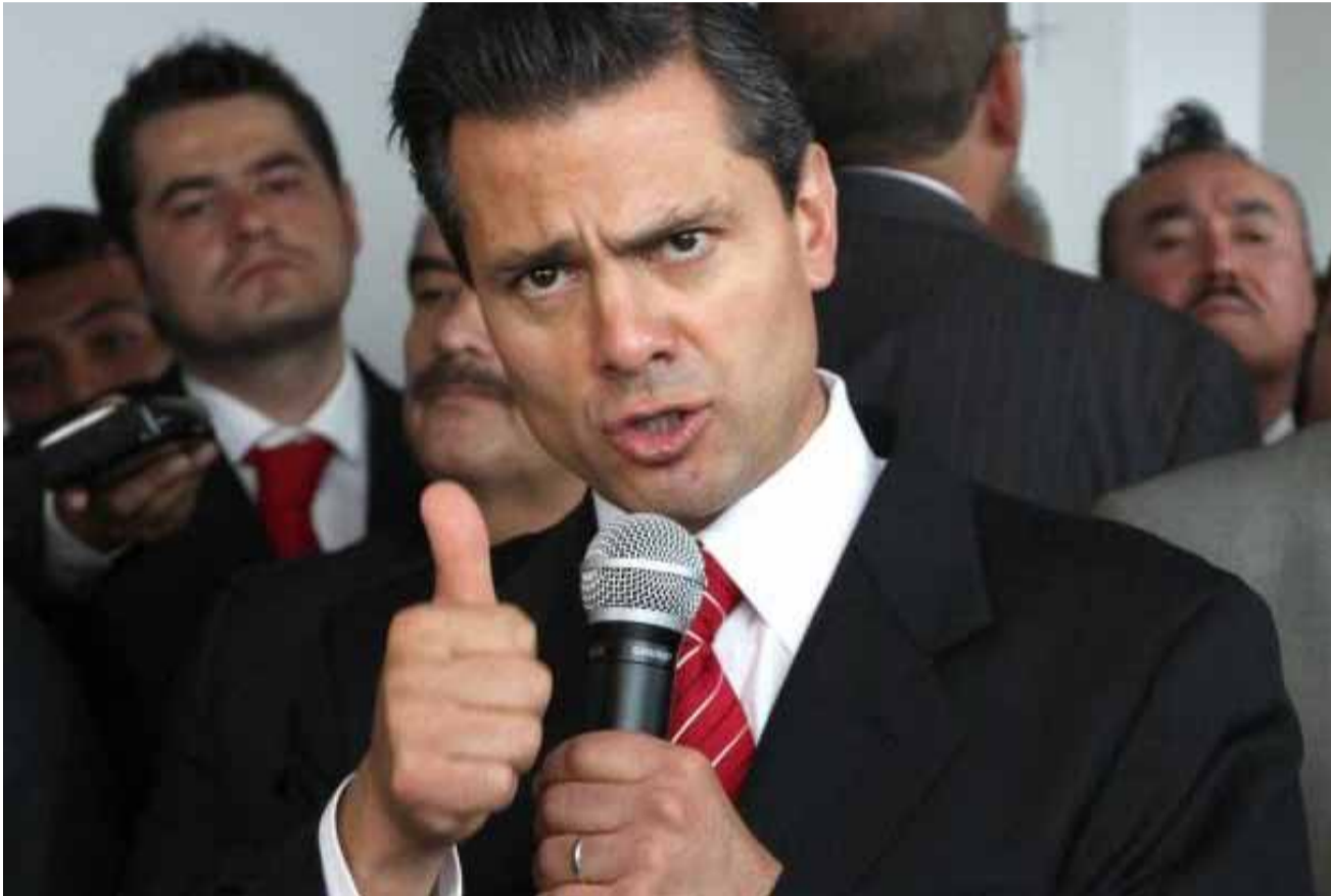
Enrique Peña Nieto

Sólo el tiempo dirá si fue acertada la decisión del Partido Revolucionario Institucional (PRI), en particular de su virtual candidato presidencial Enrique Peña Nieto de romper con “La Maestra” Elba Esther Gordillo y su partido Nueva Alianza (Panal).