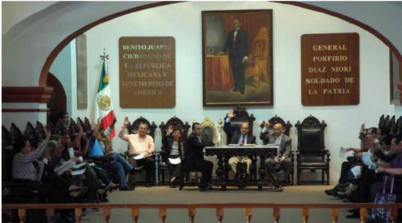
Sesión donde el Ayuntamiento de Oaxaca aprobó descuentos de predial

E l impuesto predial constitucionalmente es una potestad municipal, que no ha sido aprovechada óptimamente en nuestro País. La relación de la recaudación del predial versus el PIB nacional es de 0.2 %, muy por debajo del promedio de nuestros principales socios comerciales, 0.1% excluyendo al DF, incluso respecto a otros países de América Latina, cuya recaudación no rebasa el 0.6% en ningún país, aunque es la principal fuente de ingresos propios de los gobiernos locales.