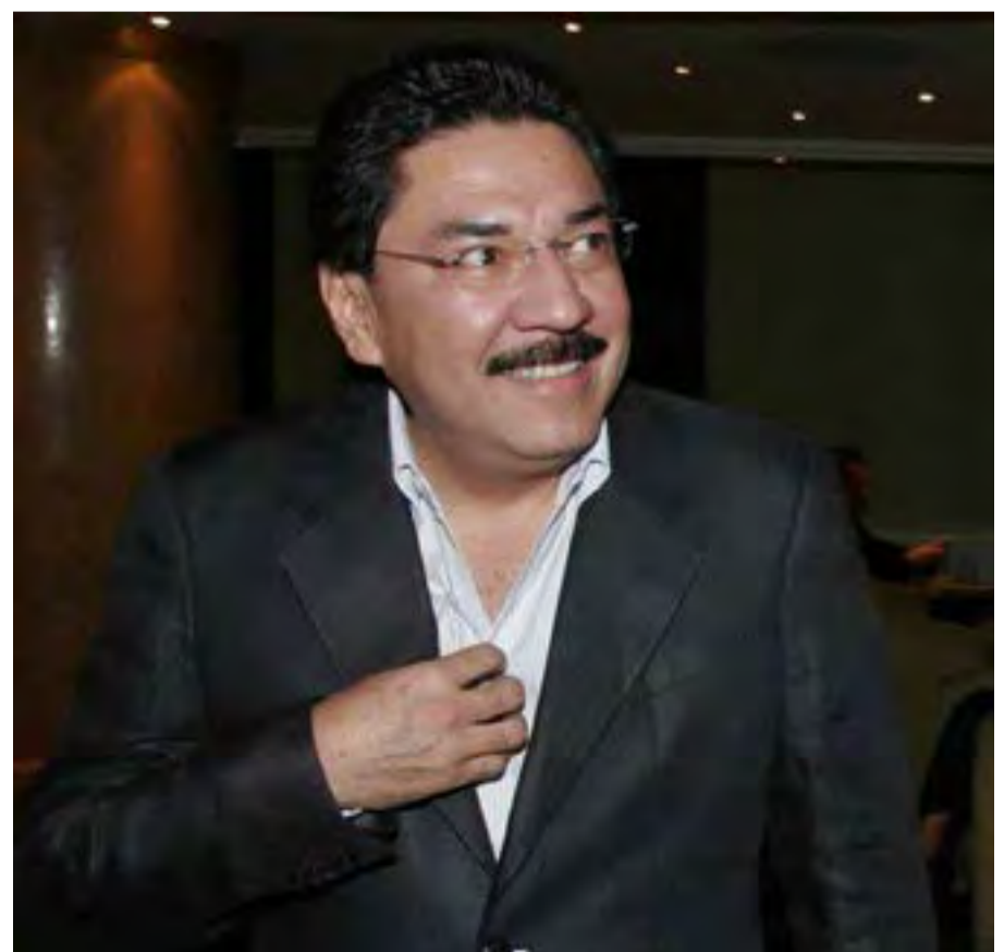
Ulises Ruiz, ex gobernador de Oaxaca

isidoroyescas@yahoo.com.mx Twitter: @IsidoroYescas