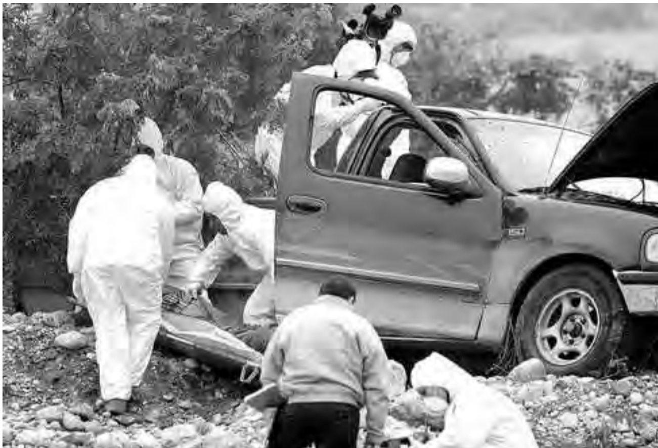
Personal del forense de Monterrey levanta el cuerpo de un agente de la Policía Ministerial

bles, de planes de trabajo mucho –pero mucho– más concretos y productivos de entusiasmo, esperanzas y mesura.