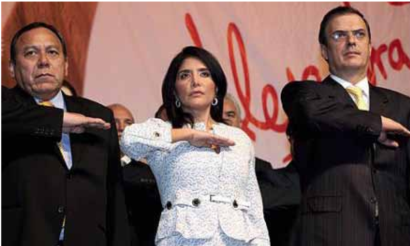
Jesús Zambrano, presidente nacional del PRD, Alejandra Barrales y Marcelo Ebrard, Jefe de Gobierno

L uego del pronunciamiento de ayer, la cosa está más que clara en el asunto de Alejandro Barrales y su fallida lucha por la Jefatura de Gobierno del DF: la diputada resistió al canibalismo de las tribus perredistas y obtendrá una candidatura para el Senado.